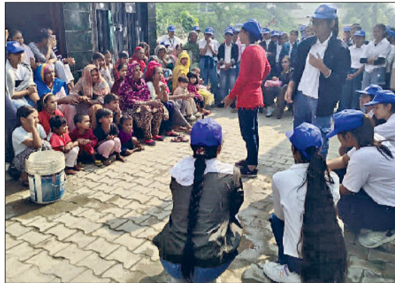
भिवानी। लोगों को नशामुक्ति के प्रति जागरूक करती छात्राएं।