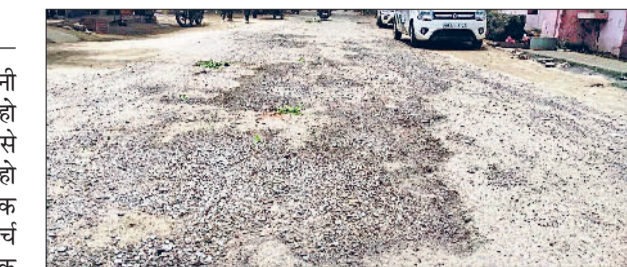
महेन्द्रगढ़। गोशाला के पास जर्जर अवस्था में सड़क।