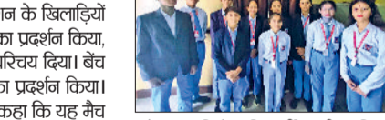
महेन्द्रगढ़। विजेता विद्यार्थी खुशी जाहिर करते हुए।