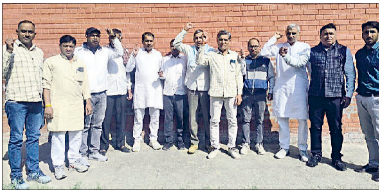
भिवानी। पुरानी पेंशन बहाली को लेकर रोष जताते कर्मचारी।