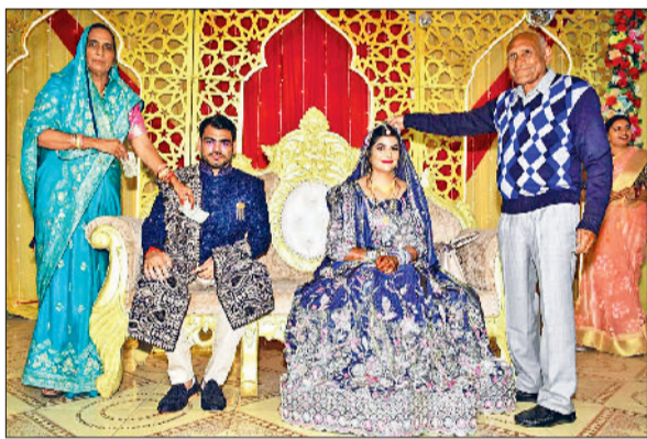
नारनौल। शादी के दौरान आशीर्वाद देते हुए।