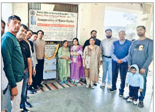
नारनौल। स्लम टैलेंट परिया में वाटर कूलर लगाते हुए।