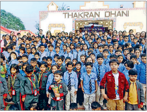
महेन्द्रगढ़। ठाकरान ढाणी का भ्रमण करते विद्यार्थी।