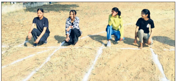
महेन्द्रगढ़। खेल प्रतियोगिता में भाग लेते खिलाड़ी।