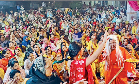
भिवानी। श्रीराम मंदिर में चल रही श्रीमद्भागवत कथा में झूमते श्रद्धालु।